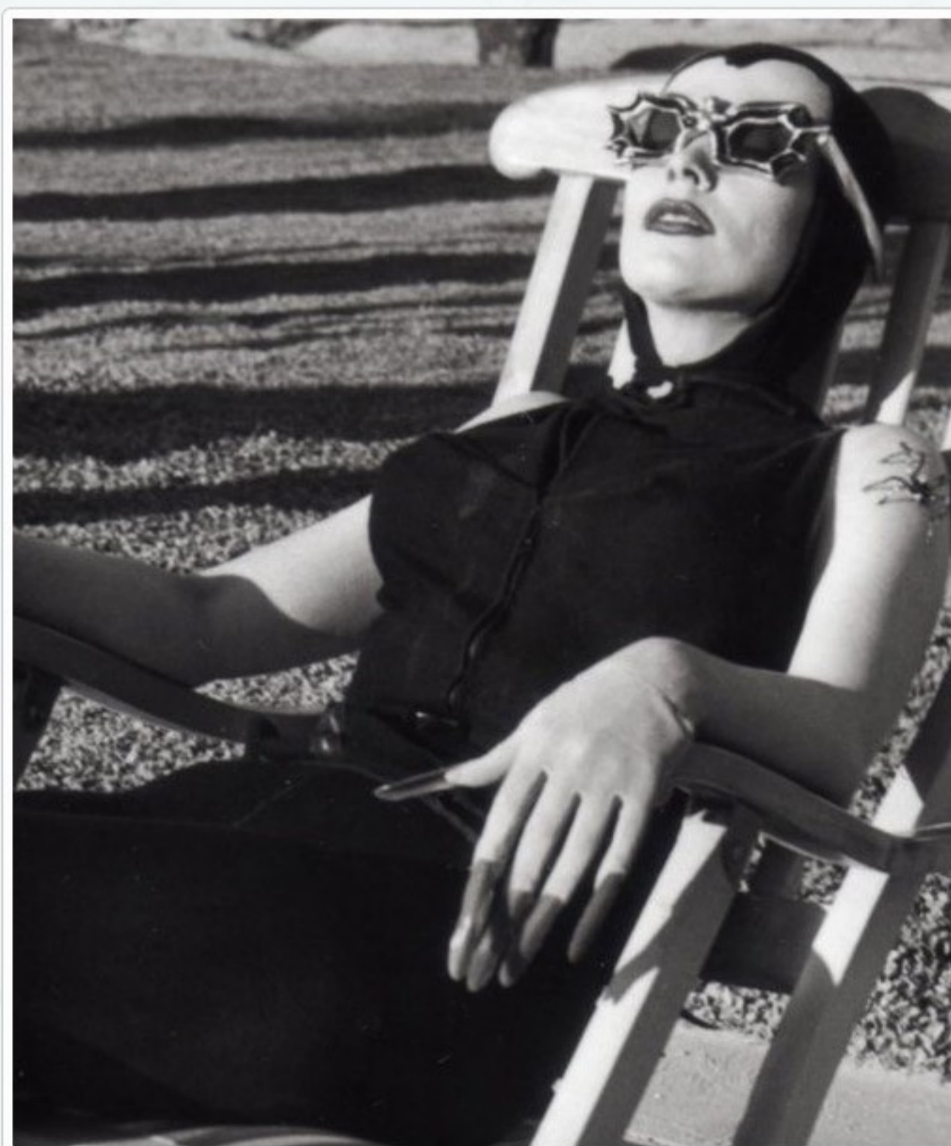
Maila Nurmi Vampira – Década de 50.

*acompanhe mais do trabalho de Alex em http://www.blogao.com.br