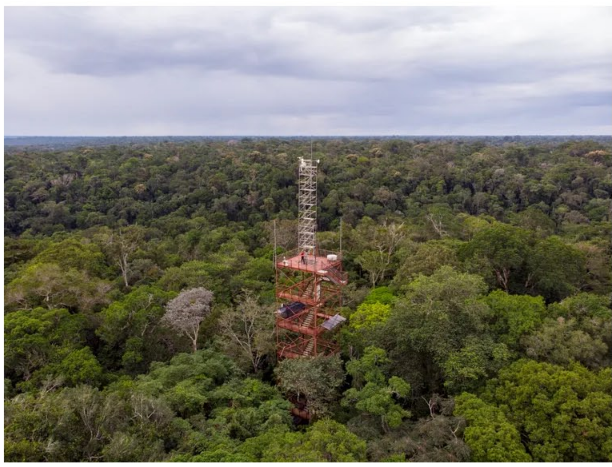
Aqui, um registro de uma área ainda imaculada da floresta amazônica.

(Vale a pena ler também: Descoberta de um DNA egípcio de 4.500 anos revela novos dados sobre sobre os homens da época )