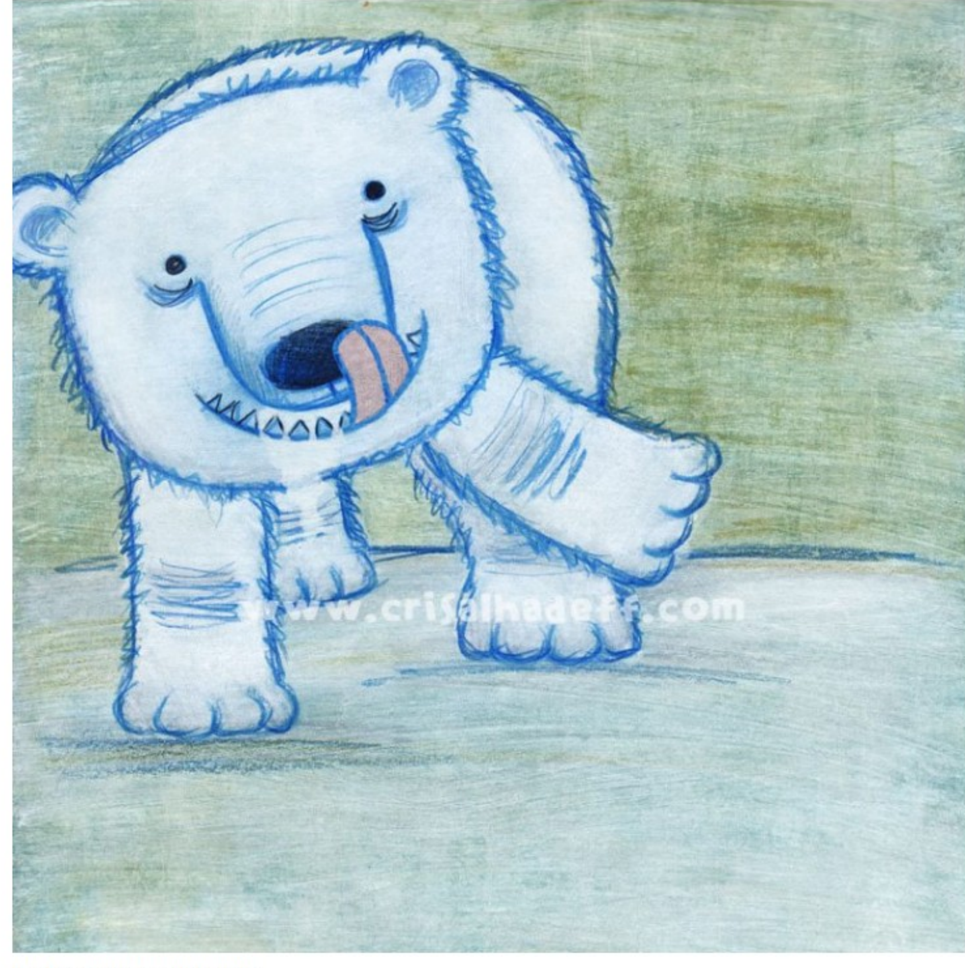
Ilustração de Cris Alhadeff

LEIA [Resenha] Fim dos Tempos está chegando